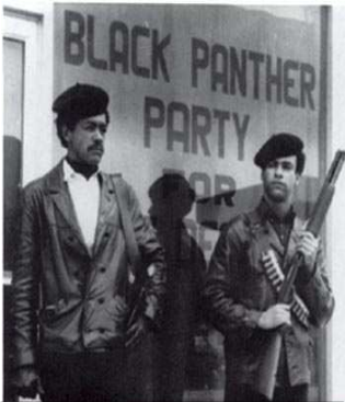
(Local du Black Panther Party (for self-defense), 1966)

Aux États-Unis, les années 1960 ont été à bien des égards très contestataires. La création de la SNCC (Student Nonviolent Coordinating Committee) en 1960 contre l'intervention de l'armée américaine dans le monde s'est transformée dans les années suivantes en lutte ouverte contre la guerre du Vietnam. Le SDS (Students for a Democratic Society) formé en 1962 combiné au FSM (Free Speech Movement) de Berkeley en Californie va prendre des proportions importantes en luttant pour la démocratisation des écoles et de la société. On assiste à plusieurs importantes manifestations et à des occupations d'universités notamment en 1967 et en 1968. La lutte que mène les afro-américain-e-s prend aussi de l'ampleur et tend à rejoindre la lutte et les perspectives prolétariennes notamment avec le Black Panther Party créée en 1966.