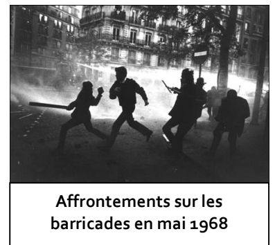
Affrontements sur les barricades en mai 1968

En Allemagne, dans la foulée du Mai 68 français, la SDS (Union allemande des Étudiants Socialistes) s'active et se radicalise. De violentes occupations d'universités, des manifestations anti-guerre et contre la réduction des droits civils seront menées en 1966, 1967 et 1968.