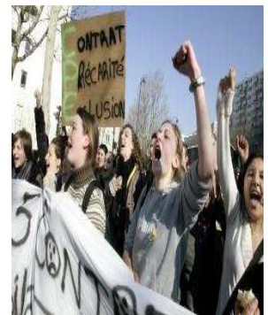
Manifestation étudiante en France contre le contrat de première embauche (CPE)

Sans travail politique révolutionnaire indépendant – nous entendons par là affranchi des structures associatives multiclassistes, pratiqué sur des bases révolutionnaires explicites et non seulement syndicales –, le syndicalisme étudiant, même « de combat », devient vite un plafond dans le processus de radicalisation. D'une part, c'est un mouvement fortement marqué par les cycles, les flux et reflux de mobilisation et de combativité, le renouvellement de ses membres. Il semble difficile d'assurer autre chose qu'une simple reproduction de ses effectifs militants. C'est que le statut d'étudiante ou d'étudiant est par définition, dans notre société, transitoire. Inévitablement, à plus ou moins long terme selon les parcours, on prend sa retraite du mouvement. Combien sont alors rattrapé-e-s par les effets de leur indifférence face à la responsabilité de constituer des débouchés politiques au militantisme étudiant, des débouchés qui permettent d'envisager des problèmes sociaux et politiques plus larges que les luttes étudiantes immédiates et de rassembler et d'organiser au-delà d'un groupe social aussi restreint ? Ceux et celles qui ont fondé leurs espoirs dans le syndicalisme ouvrier ou le milieu communautaire s'aperçoivent qu'il est autrement plus compliqué d'y être « radical-e » que dans les bastions de la gauche étudiante. Plusieurs