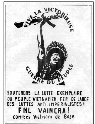
Affiche des comités Vietnam de Base, très présents sur les campus lycéens et universitaires en France, 1967)

La fin des années 1960 est donc marquée par une radicalisation continue du mouvement ouvrier et étudiant, radicalisation teintée de socialisme et de marxisme avec pour conséquence un durcissement du mouvement et une politisation accrue qui vont amener plusieurs étudiant-es à se tourner vers la révolution, vers le communisme. Ils seront nombreux et nombreuses à passer du radicalisme spontané à la nécessité de s'organiser politiquement pour la révolution, en se basant sur la théorie révolutionnaire.